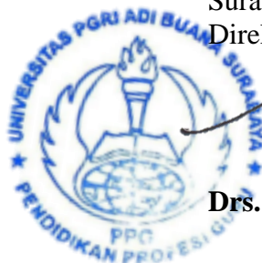
Drs. Akhmad Qomaru Z., M.Pd.

Catatan: link untuk mengunggah dokumen akan diinformasikan pada tanggal 27 Juli 2020 melalui website http://ppg.unipasby.ac.id